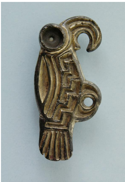
Spona ve tvaru ptáčka.

T akto popisuje pozdně římský historik Sidonius Apollinaris průvod franského prince Sigismera s jeho nově pojatou chotí na konci neklidného 5. století. Písemné