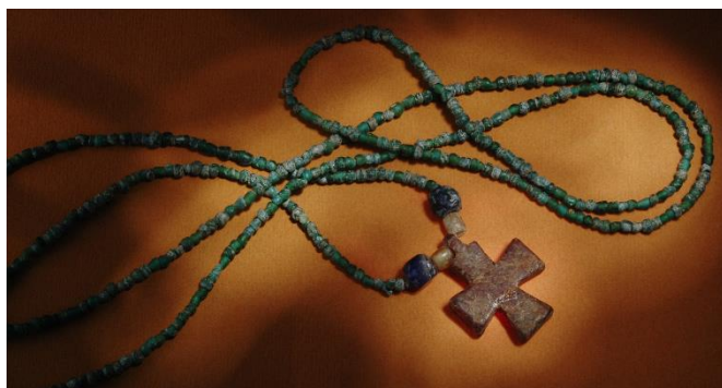
Mezi doklady křesťanství pronikajícího do prostředí raně středověkých Čech patří i tento náhrdelník s jantarovým křížkem z hrobu v Libici nad Cidlinou; 2. polovina 10. století.

K těmto proměnám docházelo nejdříve na Moravě a na jihozápadním Slovensku, kde se během prvních třech čtvrtin 9. století pod vládou rodu Mojmirovců zformoval mocný politický útvar, respektovaný Franky, Bulhary, papežským stolcem i byzantským císařem.