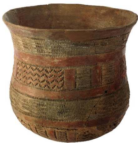
Zvoncovitý pohár.

Eneolit se dělí do několika etap. Do časného eneolitu (4500 – 3800 př. Kr.) patří zejména kultura jordanovská a michelsberská . Do staršího eneolitu (3800 – 3350 př. Kr.) se řadí kultura nálevkovitých pohárů , přičemž z tohoto období pochází např. unikátní čtvercové