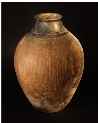
Laténská keramika ze Stradonic.

Někdy ve 4. stol. př. Kr. zaznamenáváme u nás opuštění jejich prvních monumentálních sídel – hradišť, hradby se postupně rozpadají, jak o tom svědčí výzkum na Závisti u Zbraslavi. Mohlo to být následkem prudké klimatické změny, která tehdy nastala snad během deseti let a výrazně zhoršila podmínky pro zemědělství. Osídlení prořídlo, ale pak se v průběhu doby zase zahušťovalo. Této době říkáme období plochých keltských pohřebišť. Kostrové pohřby nacházíme v řadách, s četnou osobní výbavou, bojovníky se zbraněmi, ženy s množstvím ozdob – prstenů, náramků, nánožníků i nákrčníků. Ke konci 2. stol. př. Kr. nastává prudký vzestup. Ve vyspělé společnosti se objevuje nový jev – budování