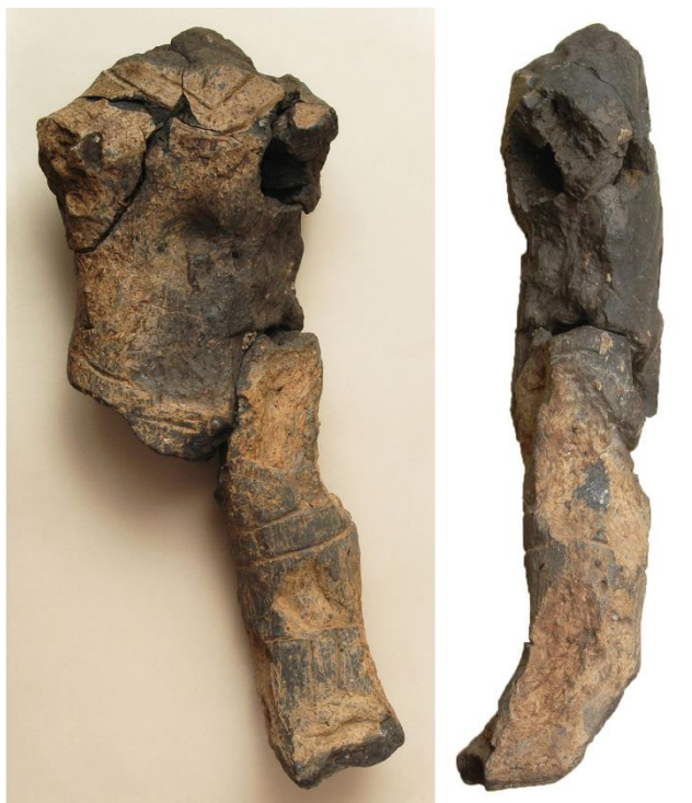
Torzo mužské plastiky z Chabařovic.

známe půdorysy tzv. dlouhých domů – staveb křivě konstrukce obdélného tvaru o délce