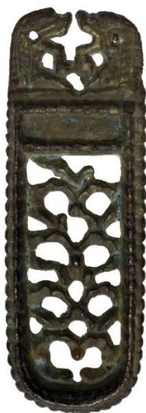
Ozdobné nákončí bojovnického opasku z avarského pohřebiště v Dolních Dunajovicích; 8. století.