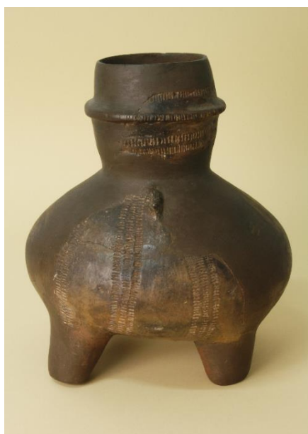
Zoomorfní nádoba z Makotřas.

Asi nejvýznamnějším objevem byl vynález oradla, což byl zpočátku pouze dřevěný hák z osekane větve. S oradlem pak souvisely objevy další, a to vynález jha, jehož pomocí bylo možné zapřáhnout k oradlu dobytčata, a objev kola a vozu. Tyto inovace vedly k tomu, že začala vznikat pole v dnešním slova smyslu, která se již nenechávala zarůst lesem, neboť aby se mohlo orat, musely se odstranit kořeny stromů a keřů a les se už nemohl obnovit. Po několika letech se vždy sice muselo nějaké pole nechat ležet ladem, ale obnově lesa zamezoval dobytek, který se na tomto tzv. přílohu pásł. S chovem dobytka souvisely patrně počátky konzumace mléka a mléčných produktů. Zvýšená produkce obilí, hlavně ječmene, zase umožňovala produkci jiného nápoje - piva. Jelikož pivo nemělo dlouhou trvanlivost, probíhala jeho konzumace