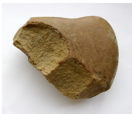
Kamenný nástroj z Mělníka-Mlázic. Foto archiv NM

O období paleolitu (starší doby kamenné) představuje nejstarší a zároveň nejdelší etapu lidských dějin. O přítomnosti prvních lidí (již představitelů rodu Homo ) na našem území nás informují především nálezy kamenných nástrojů, nejdřív