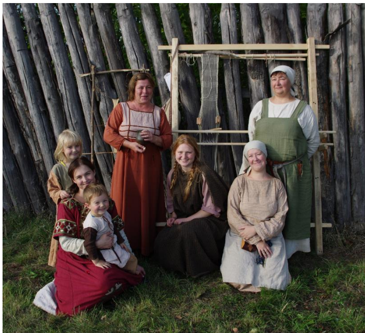
"Oživený pravěk". Rekonstrukce textilních technik.

o ochraně archeologického dědictví Evropy (tzv. Maltská konvence), která zavazuje evropské státy k tomu, aby své archeologické lokality, pokud jim tedy přímo nehrozí zničení, nevykopávaly a ponechaly je budoucím generacím. Ty by na základě této úvahy měly pravděpodobně mít dokonalejší metody výzkumu, než dnes.