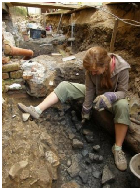
Archeologický výzkum v praxi.

Ve druhé polovině minulého století bývalo v archeologii zvykem dělat rozsáhlé badatelské výzkumy na plochách o rozloze několika hektarů. Stavební boom v 90. letech však výrazně ohrozil desítky dosud neznámých archeologických lokalit a tak se objevila akutní potřeba tzv. záchranných výzkumů. Tedy takových archeologických akcí, které mají prozkoumat a vyzvednout archeologické památky před tím, než je nenávratně zničí bagry a beton. Současným směrem archeologického bádání (samozřejmě kromě teoretického výzkumu a zpracovávání již získaných poznatků) je tedy záchrana památek ohrožených a ochrana těch, kterým zatím bezprostřední ohrožení nehrozí. Tento postup je v souladu s Úmluvou