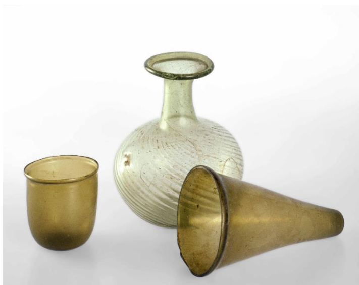
Skleněné nádoby.

Jsme stále na začátku bádání o tom, jak vypadala jejich sídliště – domy a zástavba, protože nálezů máme poskrovnu – a ani průzkumy pohřebišť nám příliš nepomáhají. V této době bylo totiž neblahým zvykem vykrádat cizí hrobky, aniž bychom tušili, proč. Byla všeobecná bída a hlad po obohacení za každou cenu tak silní, že donutili živé vztáhnout ruce na zemřelé?