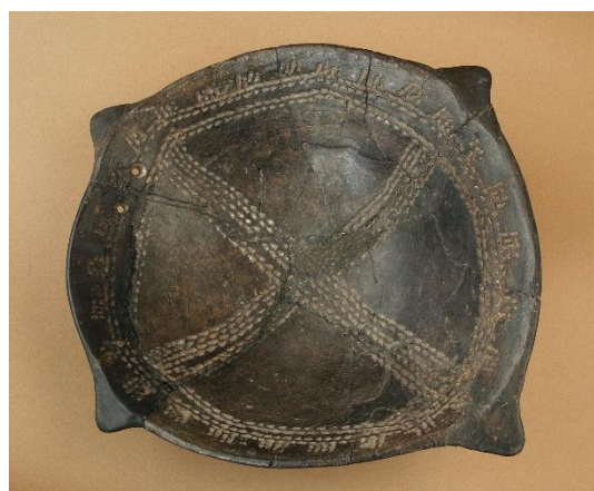
Mísa kultury s vypíchanou keramikou z Litoměřic.

Ke vzniku center neolitizace došlo nezávisle na sobě na několika místech světa; pro Evropu se stal ohniskem šíření Přední Východ. Jak přesně neolitizace probíhala, je stále předmětem živých diskusí. Existují v zásadě dvě hlavní teorie, jedna vysvětluje šíření neolitu kolonizací neolitickým obyvatelstvem, druhá šířením kulturních elementů. Otázkou zůstává i podíl původního mezolitického obyvatelstva. Do debaty v poslední době promlouvají i paleoantropologické studie (analýzy DNA apod.). Na naše území se neolit dostává v 6. tisíciletí př. n. l. První neolitické nálezy se řadí do kultury s lineární keramikou (dříve volutovou, 5600-5000 př. n. l.), která byla pojmenována podle typické výzdoby keramiky rytými liniemi. Ze sídlišť této kultury