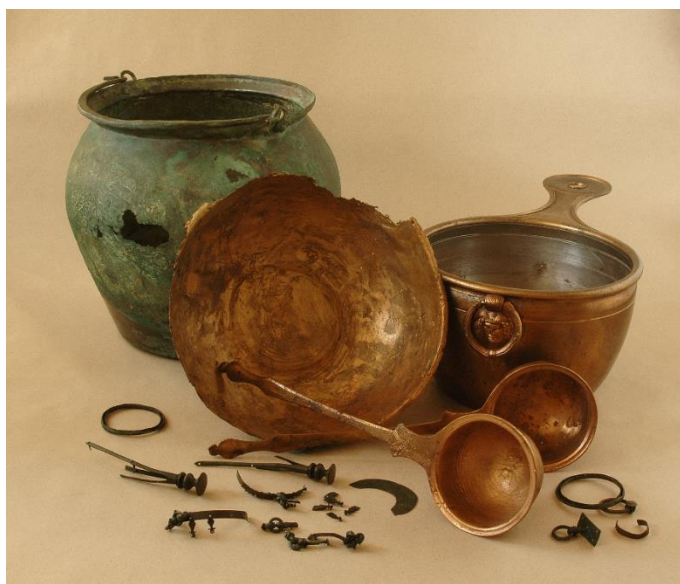
Zátiší nálezu z Řepova.

Marobud, syn germánského knížete, vyrostl v Římě, pravděpodobně jako rukojmí. Tam se naučil vyjednávat, myslet politicky a získal potřebný rozhled, který mohl použít po svém