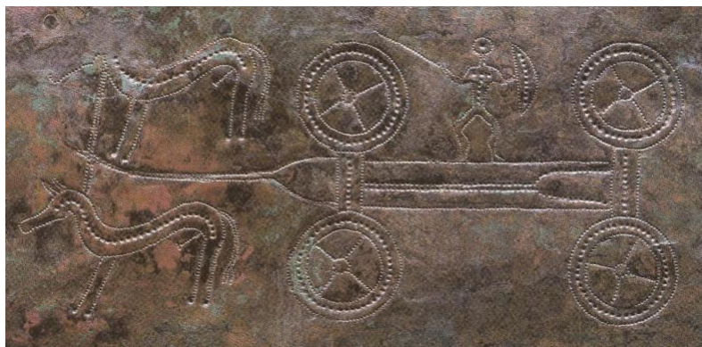
Bojovník na voze, tepáno na bronzovém lehátku.

Česká republika se může pochlubit jedním prvenstvím, které je ale známo spíše odborníkům: naše území patřilo ve starší době železné (800 - 480 př. Kr. – tak zvaná doba halštatská) k té části Evropy, kde se rodily první skupiny jejích obyvatel, známé pod jménem – Keltové, popř. Galové. Jedním z významných raných projevů této civilizace je právě pohřbívání společenských špiček na ceremoniálním čtyřkolém voze. Právě na našem území se nachází jedny z nejstarších – tradice, přísně dodržovaná v době železné po několik generací, se postupně ujala i v prostoru tehdejšího Bavorska a jižního Německa. Jak takové hrobky vypadaly?