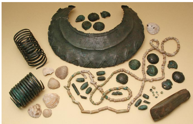
Část souboru z bohatého skříňkového hrobu z Velvar.

Období přibližně mezi lety 4500-2200 př. Kr., kdy se vedle kamenných nástrojů začíná uplatňovat i kov, konkrétně měď, se nazývá eneolit, což je slovo, vzniklé spojením řeckého „lithos“ – kámen s latinským „aeneus“ – měděný. Mědi se sice tehdy ve srovnání s kamennými nástroji využívalo, zejména v počátcích eneolitu, pouze minimálně, ovšem toto období se vyznačuje zejména tím, že se v něm odehrávaly mnohé velice významné změny, a to jak v oblasti nových zemědělských technologií, tak ve vývoji lidské společnosti, přičemž obojí spolu úzce souviselo.