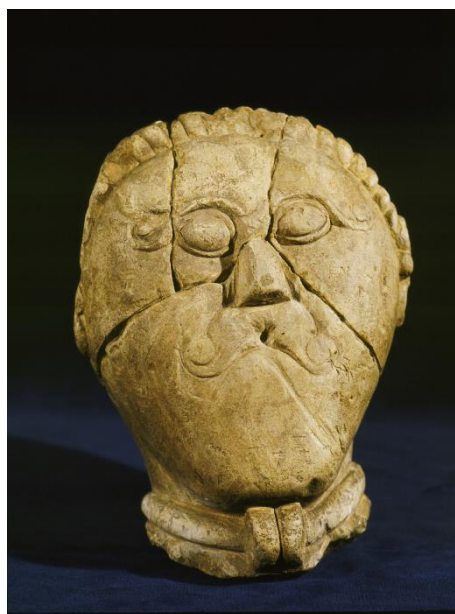
Keltská hlava z Mšeckých Žehrovic.