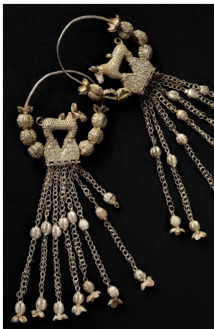
Stříbrné ozdoby hlavy pocházející z hrobu tzv. „kouřimské kněžny“ jsou příkladem šperku české provenience, který navazuje na velkomoravské tradice; 1. pol. 10. století.

tlakem nově příchozích Slovanů a kočovných Avarů – Langobardi, kteří sídlili na jižní Moravě, v dolním Rakousku a Panonii, založili po příchodu turkických Avarů do Karpatské kotliny v roce 568 království v Itálii a germánské elity z Čech odešly na jihozápad a seskupily se v kmeni Bavorů. České země byly osídleny skupinami Slovanů, kteří od počátku 6. století odcházeli ze svých sídel v povodí horních toků Dněpru, Dněstru a Visly. Kulturu nejstarších slovanských osadníků na našem území charakterizují zemědělské osady tvořené zahloubenými obytnými domy (polozemnicemi) vybavenými kamennými píčkami a hrubě hotovenými nezdobenými keramickými nádobami. Svě mrtvé spalovali a ve vzácně dochovaných hrobech nacházíme jen malé množství žarem poškozených milodarů.