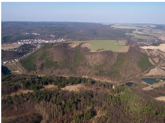
Letecký pohled na oppidum Stradonice.

K eltové, Germáni, Slované... první velké skupiny obyvatelstva v našich zemích, které můžeme pojmenovat. Dva pojmy jsou všeobecně známé. Ale kdo byli a kam zmizeli Keltové? Před nimi byl jen „temný pravěk“, obyvatelstvo bez názvu, v průběhu tisíciletí se zde měnící a pro nás odlišitelné jen hmotnou kulturou, podle které je archeologové rozlišují. V 5. stol. př. Kr. se objevují na našem území Keltové, snad kmen Bójů, který dal naší zemi první jméno – Boiohaemum. V jistém smyslu to byli první „Evropané“, sjednotili kulturně na pět století západní a střední Evropu a přinesli rychlý společenskoekonomický vývoj. Jejich skupiny se u nás objevily s historickým tažením do střední a jižní Evropy a pak splynuly s domácím „bezejmenným“ obyvatelstvem. Četné keltské kmeny obývaly velkou oblast západní Evropy od východní Francie přinejmenším do jižních Čech. Názory na to, do jaké míry tu sídlili už dříve, se různí. Historické zprávy dokládají jejich tažení, tzv. keltskou expanzi, při zpětném tažení se dostávali také k nám.