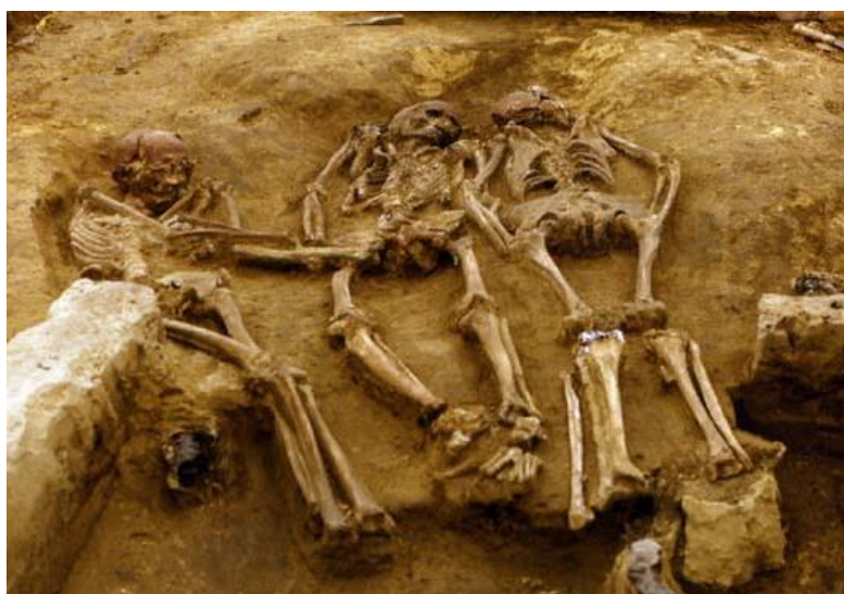
Trojhrob z Dolních Věstonic.

Vypalování hlíny, tedy vynález keramiky, která se přitom začala používat k výrobě nádob až v neolitu, v době prvních zemědělců, patří mezi několik světových prvenství, které doba našich lovců mamutů přinesla. Z pálené hlíny se v Dolních Věstonicích našly i figurky různých zvířat. Z dalších inovací to je začátek používání jednoduchých textilií z kopřivových vláken a možná i počátek domestikace psa. O rytině na mamutím klu z Pavlova se zase uvažuje jako o mapě Pavlovských vrchů, což by bylo první „kartografické“ dílo vůbec. Ze známého hrobu šamana z Brna - Francouzské ulice pochází