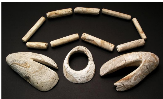
Spondylový šperk z Kadaně.

P řechod od lovecko-sběračského způsobu života k zemědělství znamenal tak důležitou změnu v dějinách lidstva, že již v roce 1936 zavedl britský archeolog australského původu V. G. Childe (1892-1957) pojem „neolitická revoluce“. Proces