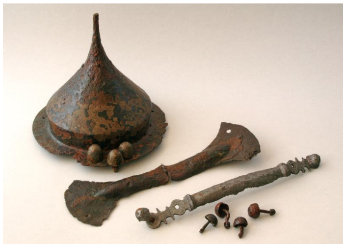
Zátiší předmětů z Řepova.

mužů!) pod velením Sentia Saturnina a Tiberia, budoucího římského císaře, měly postupovat, každá z jiné strany, do nitra Čech. Postup však musel být přerušeno, ještě než došlo k prvním střetům kvůli povstání v Pannonii, jedné z římských provincií, které si vyžadovalo okamžitý zásah. Prozíravý Marobud tedy uzavřel s Tiberiem mírovou smlouvu, která mu, za cenu zachování loajality Římu, zajišťovala nezávislost.