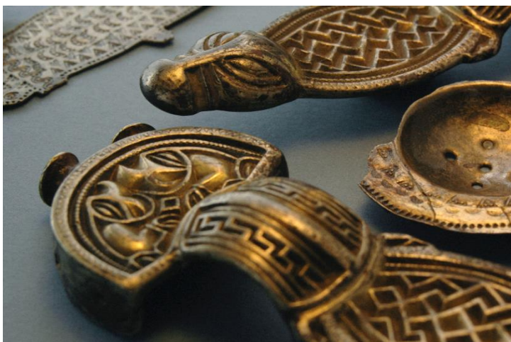
Detaily nálezů z bohatého ženského hrobu ze Světce.

vysoce postavených obyvatel naší země byly spony nejrůznějších tvarů a velikostí; o svůj vzhled pečlivě dbali – máme množství nálezů toaletních potřeb a kostěných hřebenuů ukládaných do vyřezávaných parohových obalů a stolovali z luxusních nádob z dovozu.