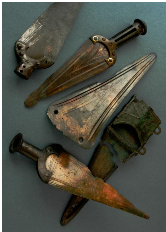
Hromadný nález dýk z Prahy 6 - Suchdol.

Často probíhal tvrdý boj o zajištění a kontrolu zdrojů surovin, mocenské pozice, sídelní místa a obchodní trasy. Došlo tak ke změnám v sociální struktuře a vytvoření horní třídy,