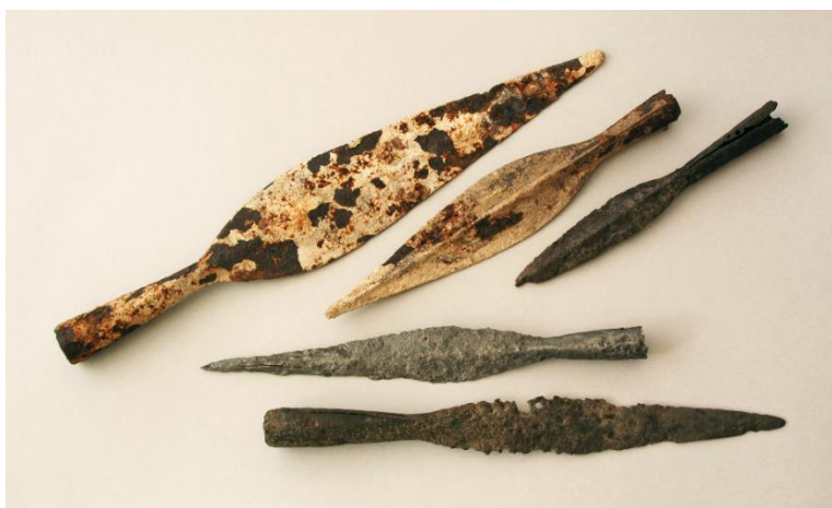
Hroty kopí z Řepova.

Této smlouvy se držel i v kritickém roce 9. n. l., kdy musela římská armáda čelit zdrcující porážce v Teutoburském lese. Ačkoliv vůdce vzpoury, germánský kníže Arminius, zcela opojen svým vítězstvím, nechal odříznout římskému vojevůdci Varovi hlavu a poslal ji na důkaz své převahy na dvůr krále Marobuda, ten její přesto v boji proti Římanům odmítl podpořit. Marobud si nehodlal mocný Řím rozhněvat. Pietně nechal Varovu hlavu zabalit a odvést do Věčného města, kde byla pohřbena.