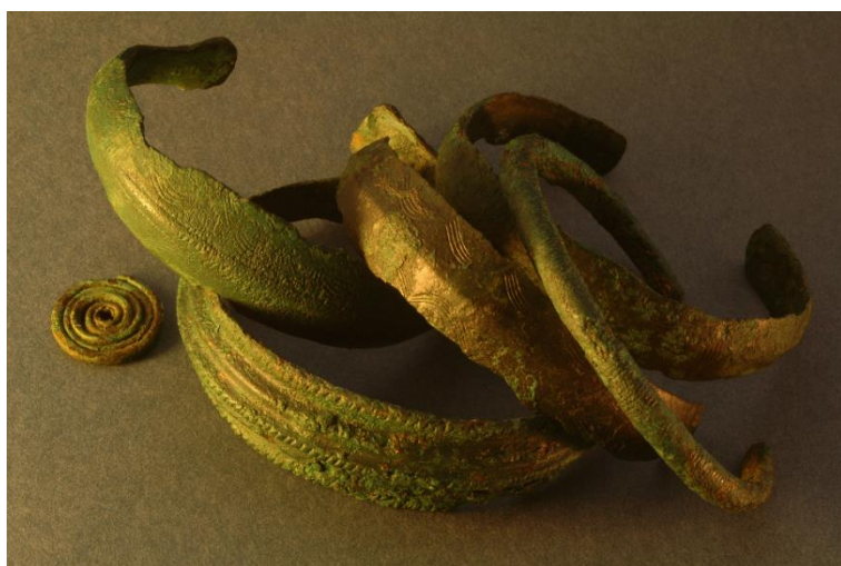
Bronzové náramky.

Měď se používala již v předcházejícím období, kdy ji lidé využívali vedle zlata a stříbra, vyskytujících se rovněž v čisté formě, pro výrobu předmětů spíše estetické funkce. Teprve bronz, coby cílená slitina složená z 90% mědi a 10% cínu, se díky svým vlastnostem, jakými je tvrdost a formovatelnost, stal konkurenceschopným vůči kameni a mohl tak dát jméno nové epoše: době bronzové.