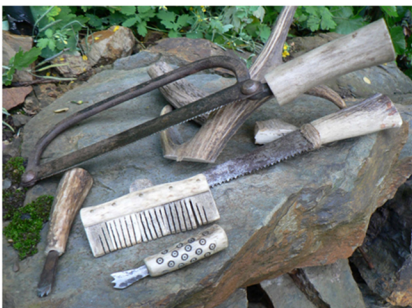
Nástroje používané při opracování kosti – pilka, dlátka, rydla. Výroba a foto Petr Floriánek, Skjaldborg, o. s.