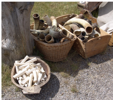
Surovina připravená k prodeji.