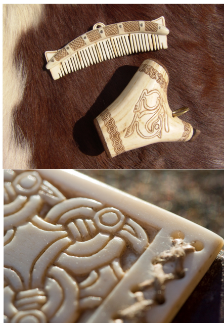
Výrobky z parohu a kosti. Výroba a foto Jonáš Janků, Michal Janků, Skjaldborg o. s.

Kost a paroh začal člověk k výrobě předmětů využívat již na počátku lidských dějin - ve starší době kamenné. Důvodem byla snadná dostupnost surovin (člověk je získával z ulovených zvířat nebo sběrem shozených parohů či kostí mršín) i jejich snadná opracovatelnost pomocí kamenných nástrojů. Významnou surovinou byla v paleolitu rovněž mamutovina, kterou pravěcí lovci získávali z mamutích klů.